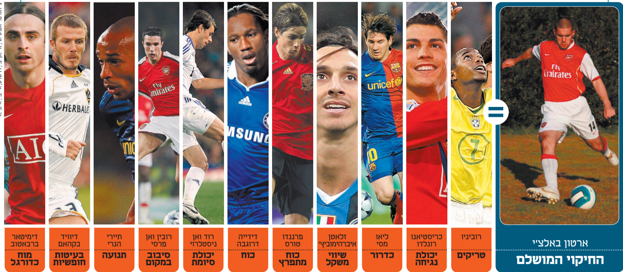
אמסטיט, איי.איי.פי, דוטקום איי.פי, אי.פי.טי